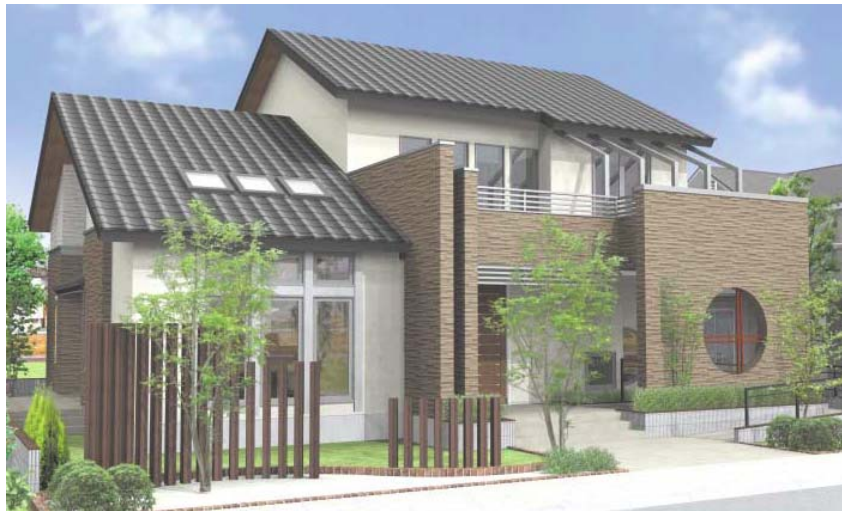
■北海道マイホームセンター札幌会場内モデルハウス（イメージパース）